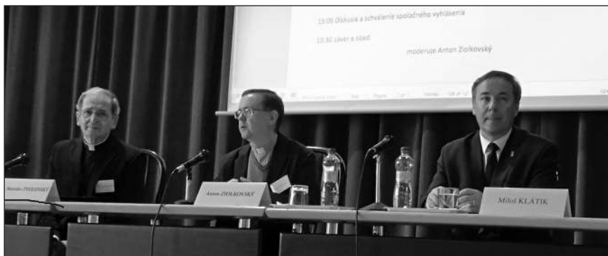
A képen balról Stanislav Zvolenský metropolita-érsek, a Katolikus Püspöki Konferencia elnöke, Anton Ziolkovský, a Katolikus Püspöki Konferencia titkára, Miloš Klátik, a Szlovákiai Evangélikus Egyház püspöke, a Szlovákiai Egyházak Ökumenikus Tanácsának elnöke látható.

Tegyünk meg minden tőlünk telhetőt minden, az erőszak által veszélyeztetett személy hatékony védelme érdekében, de egyenlő módon az egészséges házasságok és családok támogatása érdekében is.