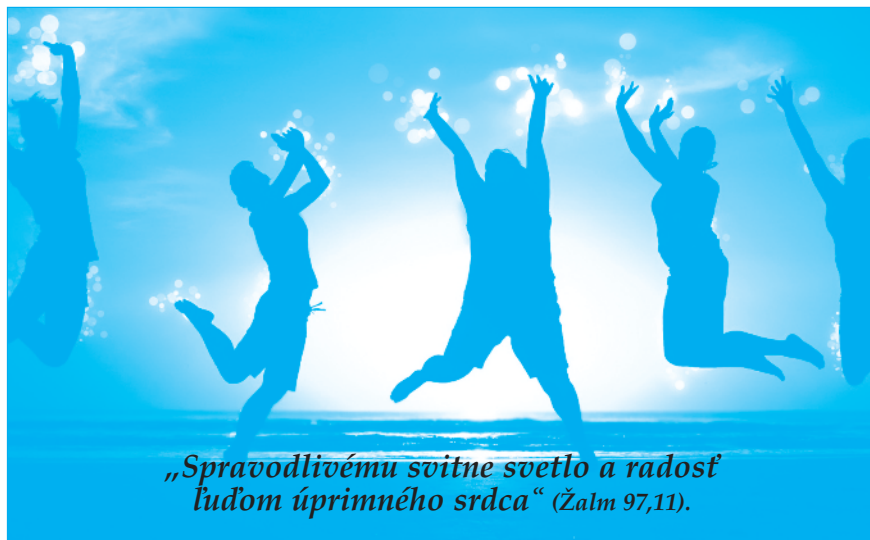
„Spravodlivému svitne svetlo a radosť ľuďom úprimného srdca“ (Zalm 97,11).

ostalo, čo ponúka iný pohľad na život, na pravé hodnoty a hlavne, čo by malo prinášať nádej. Ale sú to iba akési torzá, ktoré spolu dohromady nič netvorí. A už vôbec neznamenajú nič pre výzvy súčasného sveta. Trápime sa myšlienkami