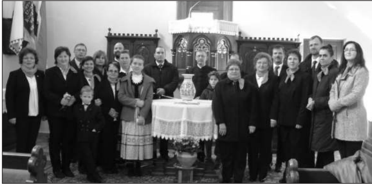
A partiumi testvérek csoportja.

Az istentiszteleten jelen sorok írója köszöntötte a partiumi vendégeket és a gyülekezet tagjait, utalva az öszösvetségi nép Úr általi reformációjára. A prédikáció közös biznyságtételként hangzott.