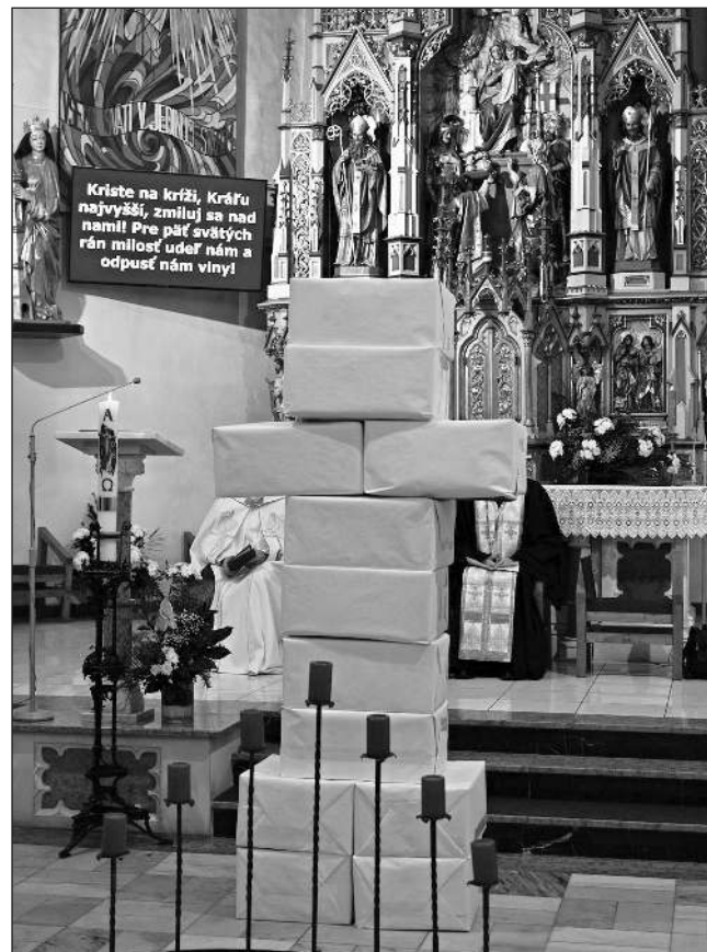
Mladí veriaci postavený múr potom zvalili a postavili z rozbitých symbolických kameňov – spoločný kríž.

Po spoločnom odriekaní nicejského vierovyznania, predstavitelia zúčastnených cirkví zažali na sedemramennom svietniku sviece, ako znaky Krista – Svetla sveta.