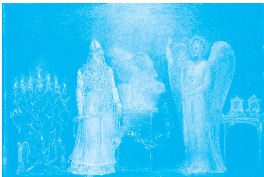
„Zachariášovi sa zjavil Pánov anjel, ktorý stál po pravej strane kadidlového oltára“ (Lk 1,11).

Treba však zdôrazniť tú skutočnosť, že vo vznikajúcom učení o Svätej Trojici Duch Svätý postupne akoby vytlačal anjelov a ich pôsobenie vo vznikajúcej kresťanskej cirkvi. Človek už nepotrebuje sprostredkovateľov medzi sebou a Bohom, nakoľko každý v Krista veriaci má už v sebe Duchu Svätého. Pán Boh s na-