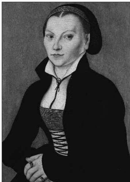
Luthera manželka, Katarína Bóra

Kým Luther žil uzavretý vo Wartburgu, jeho druhovia vykonali viacero dôležitých v celej ríši osvojených reforiem.