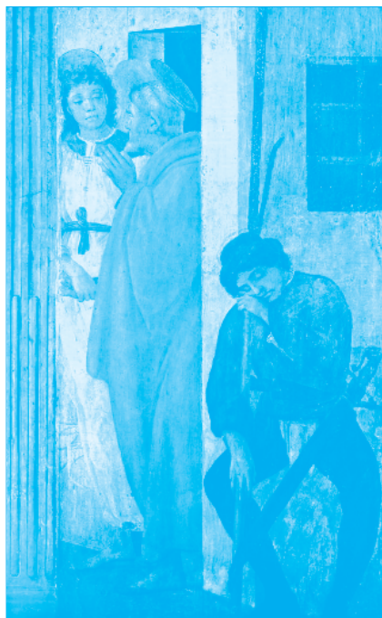
„Zrazu zastal pri ňom Pánov anjel a v miestnosti zažiarilo svetlo. Anjel udrel Petra do boku, zobudil ho a povedal: Rýchlo vstaň! Retaze mu spadli z rúk a anjel mu povedal: Opáš sa a obuj si sandále. Peter to urobil. Anjel mu potom povedal: Prehod' si plášť a poď za mnou!“ (Sk 12,7-8).

dobá. V rámci Novej zmluvy najviac o anjeloch hovorí práve jej posledná kniha – Zjavenie. Anjeli v nej poskytujú Jánovi vízie, sprostredkujúajú ich význam a plnia zároveň rozličné príkazy. Sú rozdelení do rôznych tried a hierarchií.