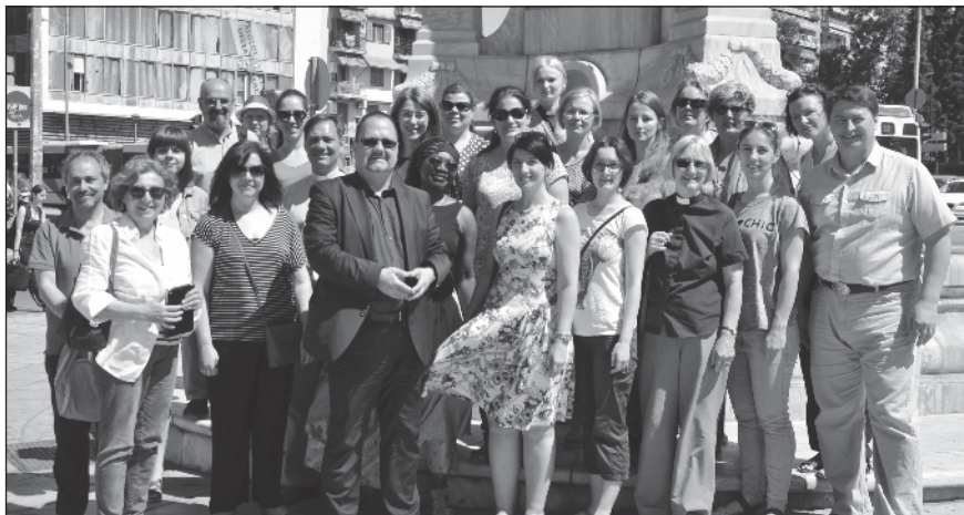
A nyári egyetem néhány résztvevője.

Az Európai Egyházak Konferenciájának (CEC-EEK) Emberjogi Bizottsága immár harmadszor rendezte meg nyári egyetemét, melynek témája a Nők és a gyermekek jogainak védelme volt. A több mint kilencven résztvevővel zajló konferencia – amely május 31-e és június 4-e közt zajlott – a görögországi szaloniki Arisztotelész Egyetem Teológiai Iskolájával közösen volt megszervezve. A konferenciának is az egyetem adott otthont. Az előadók között a különböző nemzetközi szervezeteket képviselői is jelen voltak, mint pl. az Európa Tanács, ENSZ, NATO, valamint egyházi nemzetközi szervezetek,