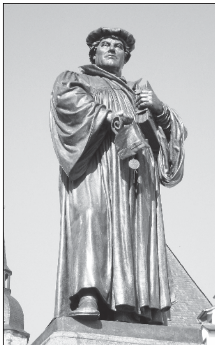
Luther szobor Eislebenben.

is ilyen jámbor szerzetes voltam tizenöt esztendeig. Isten bocsássa meg nekem. Erfurtban a laikus szerzetestársainknak négyszáz Miatyánkot kellett naponta elimádkozniuk a kánoni órák helyett.” És egy másik példa az emberi próbálkozás-