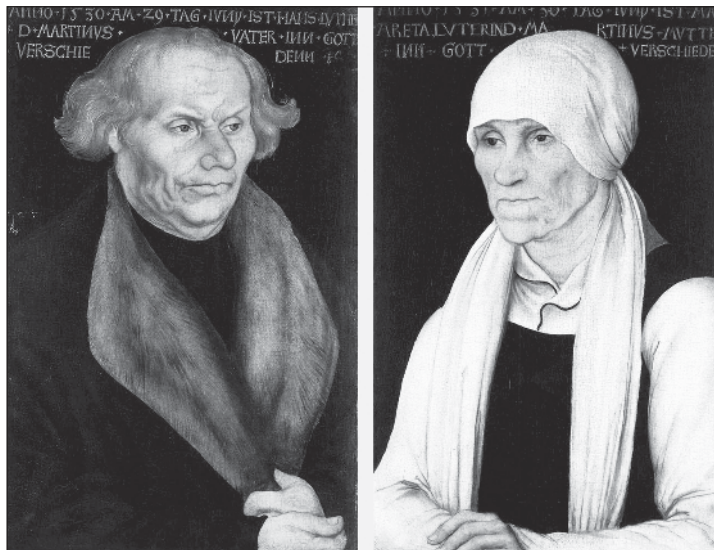
Hans és Magrethe Luther