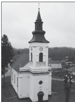
Nagykálna felújított temploma.