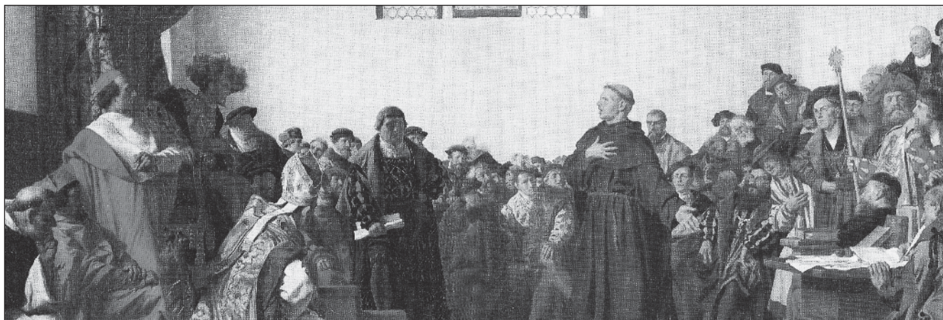
Luther a wormsi birodalmi gyűlésen.

Ellenségei félreismerik, a sátán parancsára. Megérteni pedig azok fogják, akiket Isten Szentlelke az evangélium által