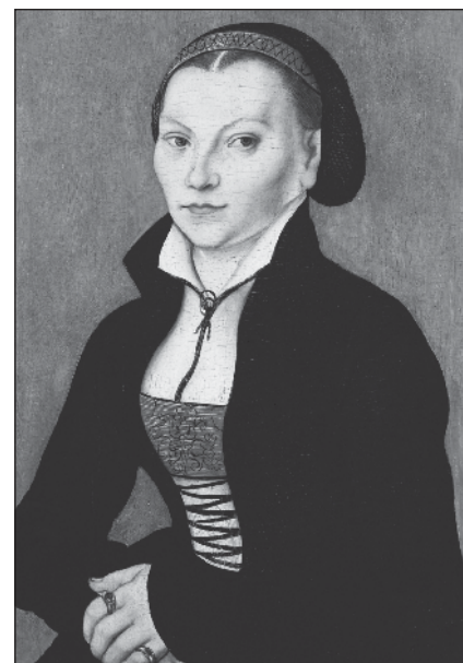
Luther felesége, Katharina von Bora

elhív a megváltottak seregébe, a szentek közösségébe. Az ilyenek azonban nem Luthert dicsőítik, hanem a Mindenható Atyát, aki Fia által megváltott bennünket s Szentlelke által Luthert eszközöztette, hogy főlragyogtassa előttünk az