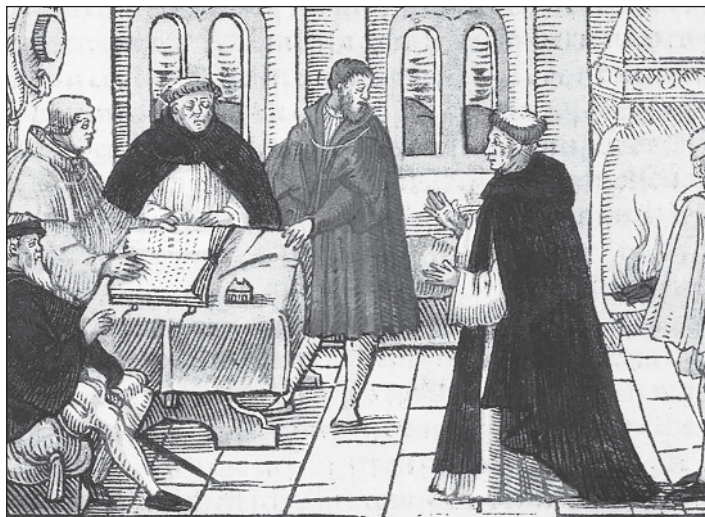
Martin Luther pred Kajetánom.

Wittenberská univerzita slúžila ako útočisko a osoba Fridricha Múdreho, ktorého menu zodpovedala odpoveď, ktorú dával v každom prípade, keď sa ho pýtali, prečo strpí Martina Luthera: „ Neviem o ňom nič zlé. Nemám s ním nič spoločné. Ak robí niečo nesprávne, polemizujte a rokJte s ním vo Wittenbergu. Tam je na univerzite. Nech odpovedá on sám. Vo Wittenbergu mám toľko veľa vedcov, že keby robil niečo zlé, ani oni by to nestrpeli. “ Kajetánovo násilné snaženie bolo zničené. Luther neodvolal svoje tézy. Rím potreboval iné riešenie. V decembri 1518 prichádza nasledujúci človek, Karl Miltitz, komorník, ktorý kým došiel k Lutherovi, spoznal všeo-