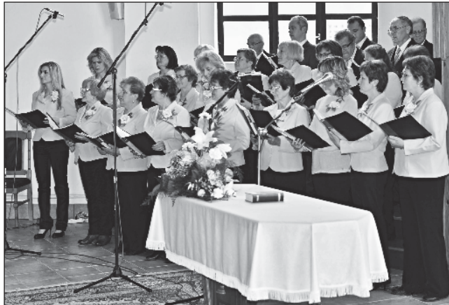
Spevokol z Michaloviec.

Po záverečnom požehnaní nasledovalo občerstvenie v zborovej sieni michalovského zboru. —jg—