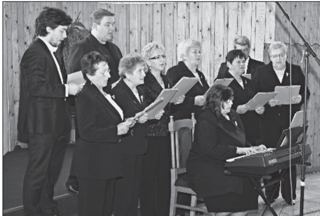
Spevokol zo Svätušťa.