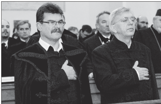
Prísaha predsedov našej cirkvi.