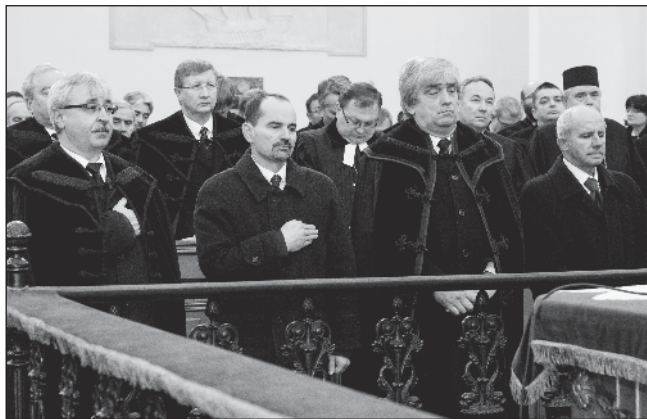
Prísaha zástupcov biskupa a zástupcov generálneho kurátora.