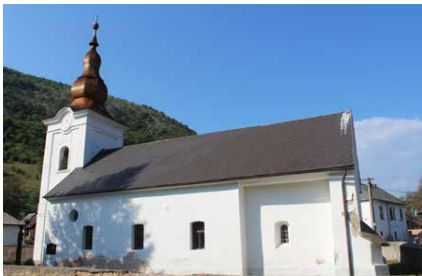
Fritz Beke Éva

A torony aljában nyílik a templomba vezető ajtó. Odabent egy csodavilág fogadja a látogatót: az 1801-ből származó ornamentális mintákkal díszített kazettás karzat és mennyezet. A sötéttkék alapon festett mennyezeti kazetták központi tábláján egy nyíló virág és az 1801-es évszám látható, és az itt található felirat, mint a régmúlt idők krónikája, 200 év után is tiszteleg a hajdani előljárók emlékének, akik Isten hajlékának átépítésén munkálkodtak: „Építettett felséges király Iidik Ferencz kegyes engedelmébül. Tisz. Bakó Ferencz uram pré: n.n.: Bartók János