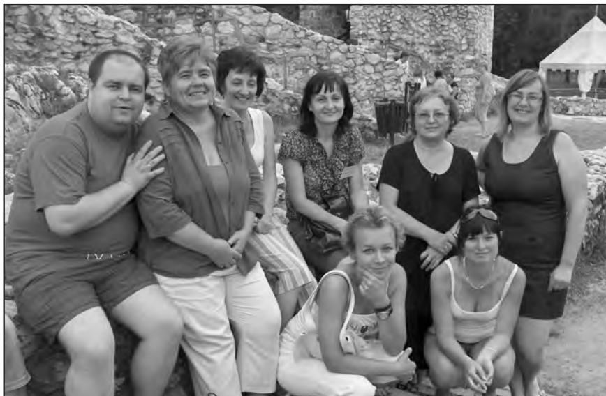
Egyházunk alapiskoláinak küldöttei a diósgyőri vár tövében

Zárásként pedig álljon itt a találkozó jelmondata, Szabó Magda vallomása: „ Hogy milyen hűséget követel tőlünk az élet, és kivel szemben, azt mindenki