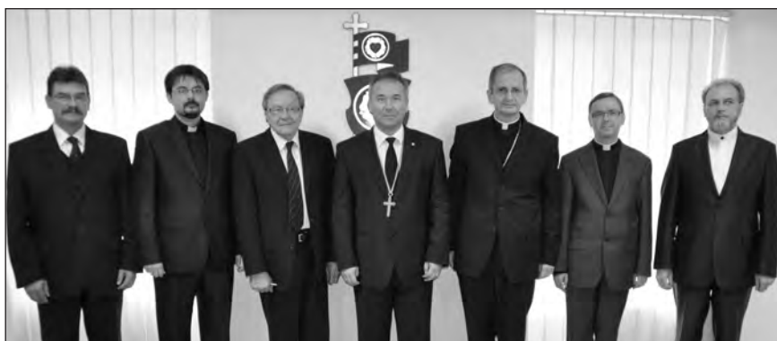
Az egyházvezetők tanácskozásának résztvevői (egyesek helyettesítőként)