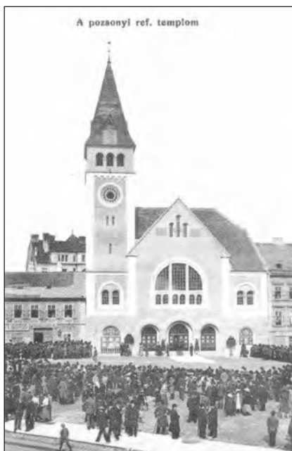
A templom a felszentelésekor

Több helyen is lehetett olvasni a pozsonyi templomszentelés kapcsán, hogy az ünnepi alkalmon megjelent gróf Tisza István miniszterelnök is. A régi pozsonyiak még a hatvanas években is emlegették, hogy a miniszterelnök az új templommal átellenben nyíló, a Prímás-palotához vezető Orsolya utcában állította le a kocsiját. Ekkor a templom előtti téren már hatalmas tömeg gyűlt össze, s gróf Tisza István gyalog és egyedül, testőrség nélkül sétált át a tömegben, beszélgetve és kezet fogva az emberekkel. Mint egy egyszerű polgár, (Folytatás a 8. oldalon)