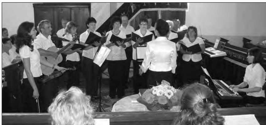
A Kárpátaljáról érkezett vegyes kar