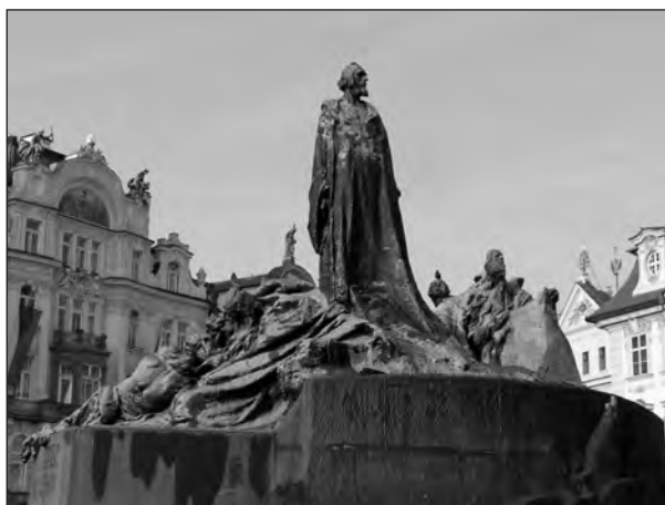
Husz János emlékműve a prágai Óvárosi téren

A 95 tételnek páratlan hatása lett. Tizennégy nap alatt egész Németországban, négy hét alatt pedig egész Európában ismertté lett Luther Márton neve. Mintha angyalszárnyon vitték volna a hírt róla. De a pápa kiátkozta. A császár maga elé idézte Wormsba. Méltán lehetett attól tartani, hogy úgy jár, mint Husz János. Luther azonban kijelentette, hogy nem fél. Elment és bátran vallást tett Jézus Krisztus igazságáról. Fellépése után