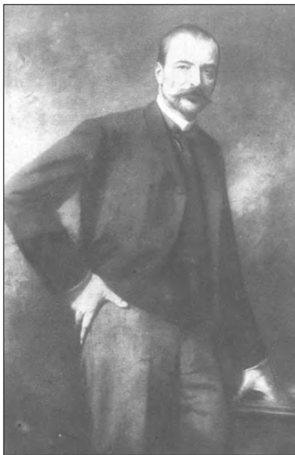
Gróf Tisza István főgondnok

gondviselés iránt és hála mindazok iránt, akik, bár más vallásfelekezetek tagjai, de a pozsonyi református egyházat ebben a munkájában elősegítették és gyámoltottak, és emellett a megelégedés és öröm érzése afelett is, hogy egyházkerületi közgyűlésünk megtartása céljából Pozsony vármegye vendégszeretettel vehetjük igénybe. Abban a tényben, Főünnepi Közgyűlés, hogy közgyűlésünket itt, ebben a helyiség-