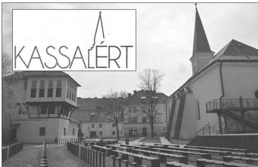
Az egyik leendő helyszín a templom tőszomszédságában: a Rodostói Múzeum kertje

A találkozóra kassa-ert@reformata.sk címen lehet jelentkezni, és erről a címről tudunk a felmerülő kérdésekre válaszolni. A rendezvényről külön honlap tájékoztatót, mely egyházunk hivatalos honlapjáról, a www.reformata.sk -ról is elérhető.