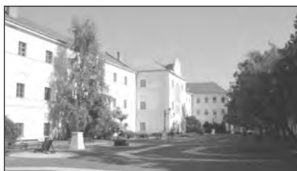
A sáropataki kollégium udvara

Hogy is mondta a kortárs Apáczai közlősvári székfoglaló beszédében? „ Hollandiában akkor nyílt a legtöbb egyetem, midőn a spanyolok ellen háborúztak. ” S nálunk? „ ...amely községbe pedig betette