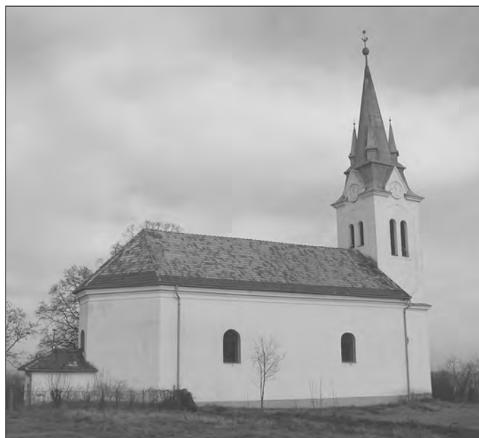
Várja az egyháztól elidegenedteket a harmaci református templom

meghalnak, és nagyon kevés gyermek születik. Nagyon fontos lenne, hogy a fiatalokban tudatosuljon az egyházhoz tartozás fontossága, a reformátusság megtartó ereje. Ha ez megtörténne, akkor (de csak akkor!) megmarad a gyülekezet, és betölti a küldetését – véli a lelkipásztor, aki elmondja,