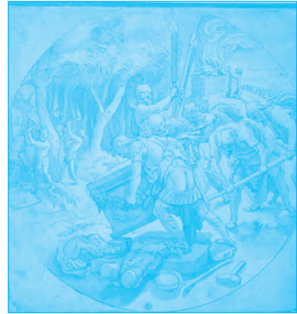
A Baal-oltár ledöntése

Most lehet, arra gondolsz: de hát ez nem is így van! De vigyázz, ezek a dolgok észrevétlenül lesznek a te bálványaiddá, és közben