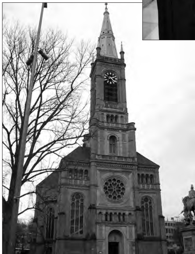
A düsseldorfi Johanniskirche