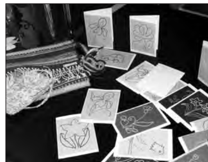
A dunaalmási otthon lakóinak néhány kiállított munkája

szolgálatába állította, és a gyógyászat számos ágában jártasságot szerzett. Az „irgalmasság háza” a gyógyításon túl a mai napig felvállalja a beteg gyerme-