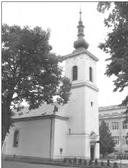
A lévai református templom. (A. Kis Béla felvétele)

Kilencven év távlatából megállapíthatjuk: Slávik György kormánytanácsosnak