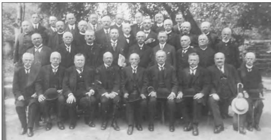
Az 1923. június 17-e és 25-e között Léván ülésezett alkotmányozó zsinat résztvevői

Nem voltak könnyű helyzetben egyházunk akkori vezetői. Az 1918 utáni öt év