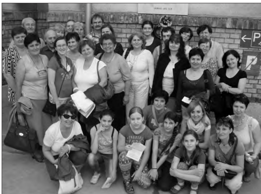
A tanulmányi kirándulás résztvevői a Bethesda Kórház előtt