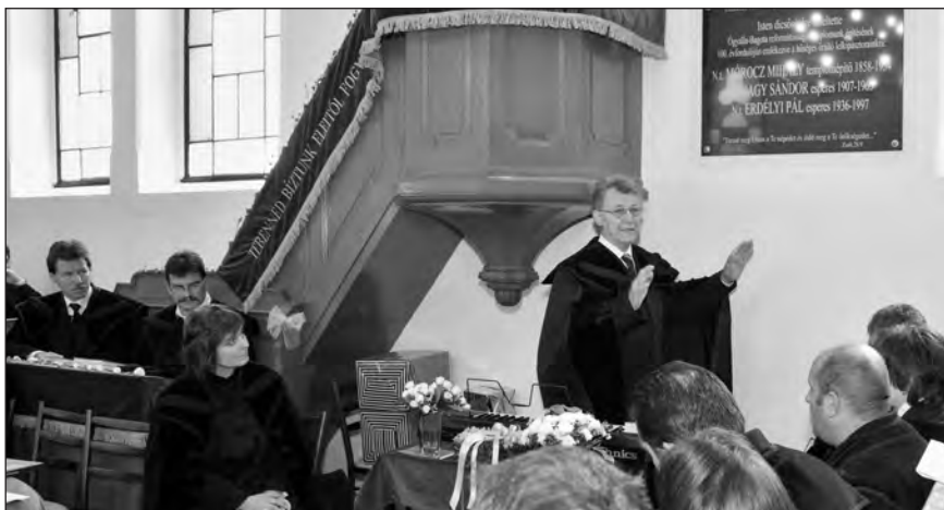
Erdélyi Géza nyugalmazott püspök áldást mond