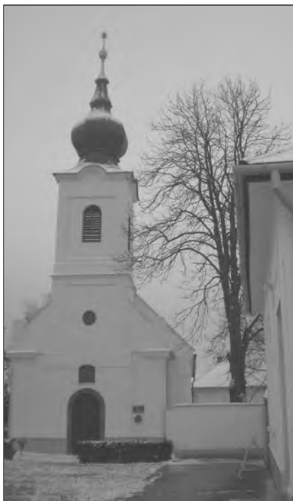
A csicsói református templom

Ilyen alkalmak közé tartozott például a tárlatnyitóval egybekötött könyvbemutató, de rendeztek szüreti délutánt a szőlősgazdáknak, volt mangalicadisznó-tor is, adventben pedig a nagymenyéri művészeti alapiskola pedagógusaiból és diákjaiból álló csapat adott koncertet. Előadás-sorozatot szerveztek a gyermekneveléssel kapcsolatos kérdéskörök megvitatása céljából, a férfiak részére pedig a fociról tartott előadást Gazdag József sportújságíró. Ilyen módon kívántak nyitni minden érdeklődő felé. A lelkipásztor hisz abban, hogy ha valaki egyszer utat talál hozzájuk – még ha nem is a templomi alkalmakon keresztül, – akkor lehet, hogy a későbbiekben keresni fogja annak a lehetőségét is, hogy miként kapcsolódjon be az istentiszteletekbe.