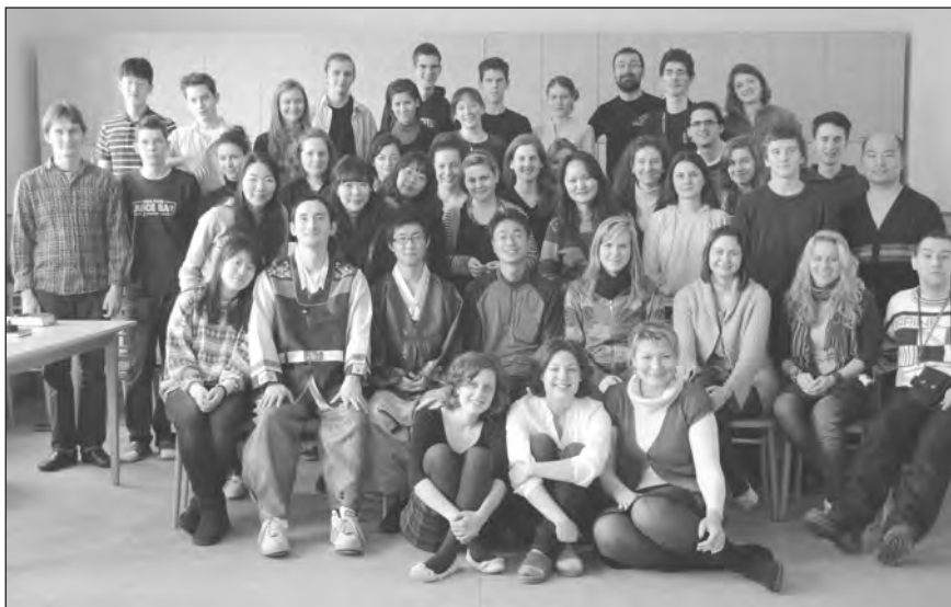
A szülői Ammí Europe missziós csoport tagjai Jókán fireszes fiatalok társaságában

Az egész világra kiterjedő vándorlás korszakában élünk. Az egyik társadalomtudós szerint a világ minden hetedik embere emigráns. Az emigráció lehetőséget kínál a közös missziós fellépésre. Nagyszerű lehetőséget nyújt arra, hogy Jézus Krisztusban szeressük,