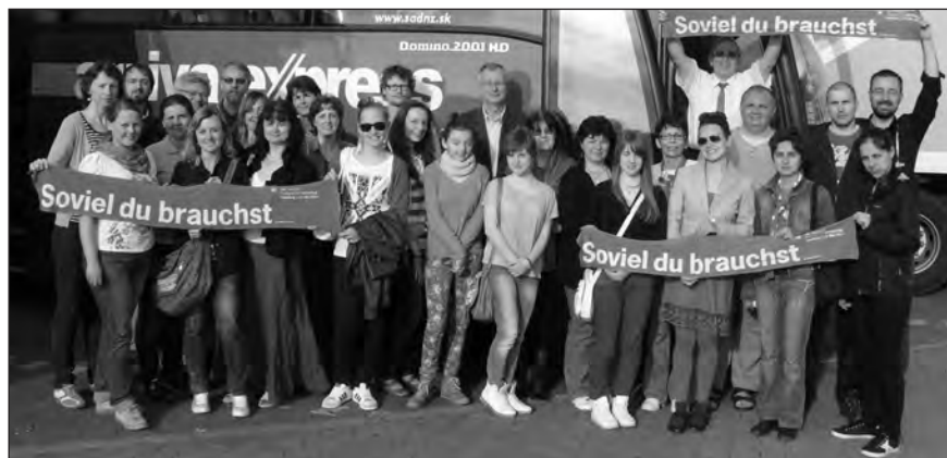
Delegáti našej cirkvi už na ceste domov