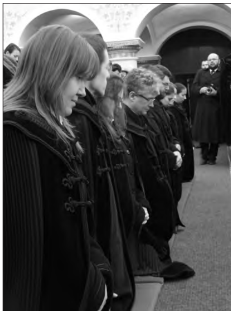
Pred vysvätením.

pripravila všeobecnú novelizáciu zákona na vyriešenie problémov, respektíve seniorálne rady, aby zistili: kto je zodpovedný za nezaplatenie príspevkov; okrem toho Synoda na tri roky zmrazila výšku príspevkov na úrovni roku 2013.