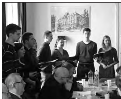
Časť členov speváckeho zboru Fireszu počas pobožnosti.

tom budeme inak vnímať aj to, čím sme, čo nás vystihuje, čo je našou identitou. Myslieť iba na to, čo je nám prirodzené, môže byť satanské; teda môže byť pre nás pokušením, ak to nezaprieme a nepodriadiame Kristu. Ak pochopíme, o čo išlo Ježišovi, už do Neho nebudeme premietat' svoje osobné či národné túžby a ciele, alebo očakávania ľudu, ale budeme svoje ciele prispôbovať Jeho cieľom. Inými slovami, svojím myslením budeme nasledovať Jeho.