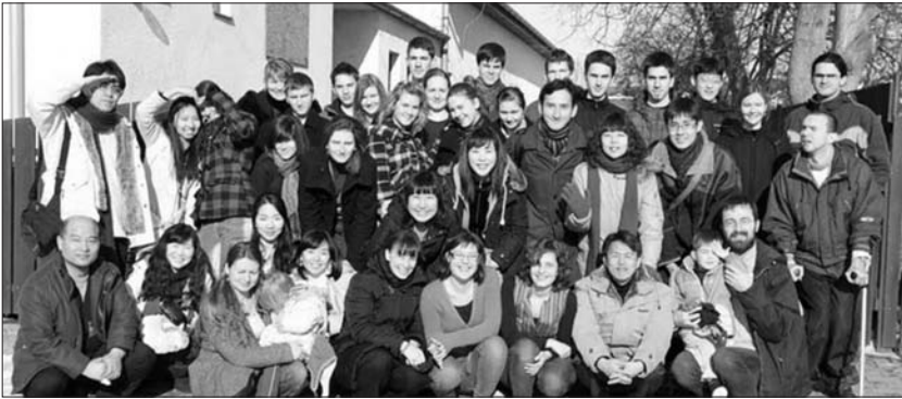
A fireszesek és a koreai vendégek Jókán.

A Csehországba és Szlovákiába érkező Ammí csapat sok ismeretet szerezhettek az európai egyház történelméről és az európai kultúráról. Szöulból tizenegy órás repülés után érkeztek Prágába. Utána Pilzent, Ostravát és Brünnt látogatták meg, majd megjelentek Jókán a Firesz Duna Menti Területi Egysége által szervezett református téli táborban. Továbbá meglátogatták a Selye János Egyetem könyvtárát, a komáromi református templomot és a gútai