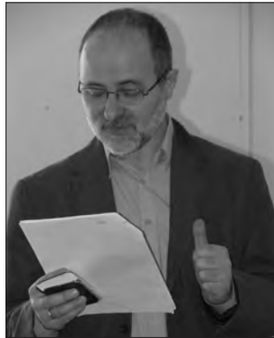
Az előadó a különbségeket számolja

Ez az énekeskönyv 253 dicséretet tartalmazott. A korábbi – amit ez felváltott –