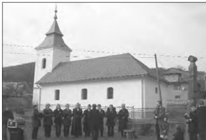
A kőrösi megemlékezés

kis küldöttsége érkezett közös megemlékezésre, immár az átjárható határokon (unió Felvidékkel!) átgördülve. A reformátusok legnagyobb ünnepe maga az istentisztelet, ami urnapján van, azaz minden vasárnapon. Ezért igehirdetéssel