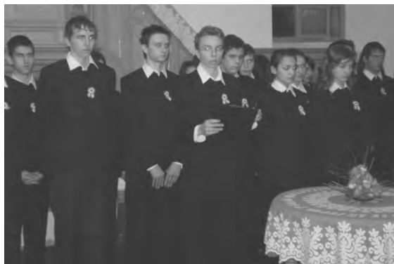
A debreceni diákok egy csoportja