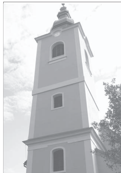
A megújult templom tornya

leglátványosabb megújuláson a templomtorony sisakja esett át. A felújítás vége felé azonban egy szomorú ténnyel kellett szembesülnünk: a pénzhány megállást parancsolt. Egyszer csak olyan döntés előtt álltunk, mely nagy befolyással bírt a gyülekezet jövőjére nézve. Elhatároztuk, hogy újabb kölcsönt veszünk fel a nemes cél érdekében, minek köszönhetően a felújított templom új szint kaphatott. A kölcsönünk a kétszáz ezer koronát súrolta, de a felújítás lassan a végéhez ért. Az összköltség mintegy 970 000 korona lett.