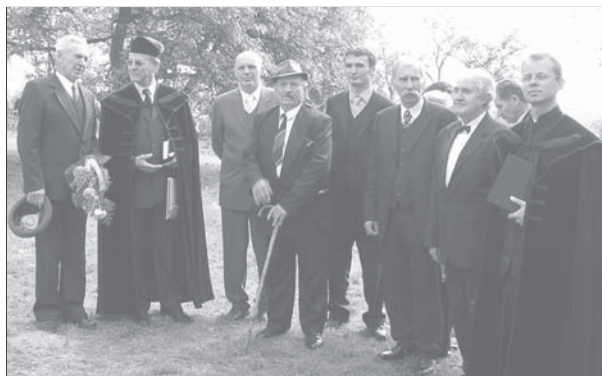
A gyülekezet elöljárói Erdélyi Géza püspökkel

Az ünneplő közösség lelki épülését Erdélyi Géza püspök igehirdetése szolgálta. Nagy Ákos Róbert esperes szintén ígérel bátorított. Beszámolót hallhattunk Pecsók Gyula gondnoktól az eddig