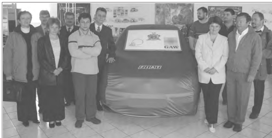
Szolgálati autók átadása 2005-ben

Mindezen támogatások mellett az elmúlt évek során számos ösztöndíjas ta-