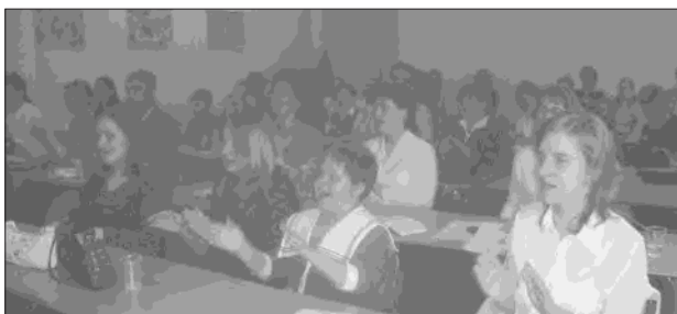
Az énekversenye résztvevői

2007. május 19-én országos énekversenyre került sor Komáromban a református teológián. Az apropót az szolgálta, hogy négyszáz éve jelent meg Szenczi Molnár Albert zoltárfordítása. A versenyre harminc gyermek és fiatal érkezett Szlovákia minden részéből, képviselve gyülekezeteiket, egyházi iskolákat. A versenyzők kétségkívül jól felkészültek a kijelölt zoltárananyagból.