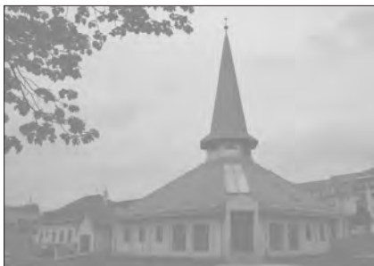
A dunaszerdahelyi templom