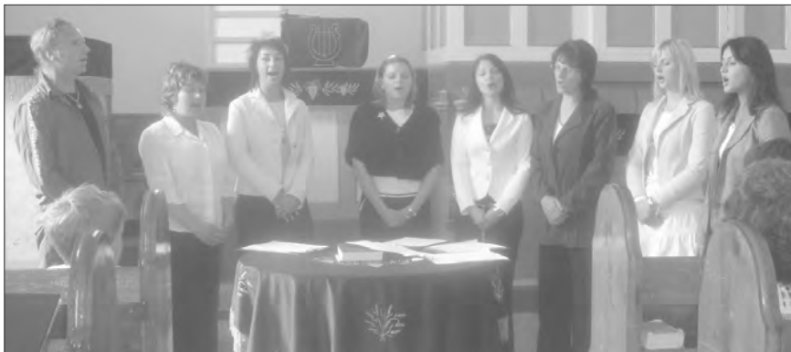
Az apácaszakállasi egyesített iskola pedagógusainak kórusa

Alistálon idén hét kórus tett bizonyosságot énekszóban: először volt közöttünk a jókai gyülekezeti kórus, az apácaszakállasi egyesített iskola tanítóinak kórusa és az alistáli gyülekezeti kórus. Másodszor vett részt a találkozóan a csilizradványi ökumenikus kórus és a kulcsodi gyülekezeti kórus. A nagymeyeri gyülekezeti éneklőcsoport töretlen lelkesedéssel immár harmadszor volt jelen és énekelt a találkozón. Idén vendégként a bátorkeszi gyülekezeti kórust is köszöntöttük, amely a komáromi egyházmegyét képviselte.