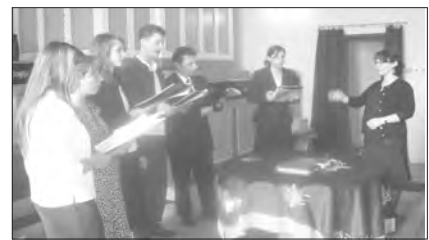
A jókai gyülekezeti énekkar

Mindkét alkalom közös kórusműve a 89. zsoltár többszólamú feldolgozása volt. Az egyes kórusok bemutatkozása között egy-egy lelki-