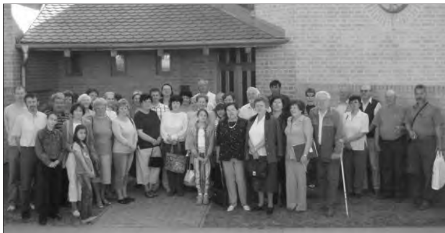
Vendégek és vendéglátók a palotabozsoki református templom előtt

A szombati nap és a vasárnap délelőtt a hely és a környék megismerésével kezdődött. Megtekintettük a Palotabozsokon élő három nemzet tájházát. A felvidéki, a székely és a sváb lakosság életének tárgyi emlékei, egy hatvan évvel ezelőtti állapot tárult elénk. Vasárnap délután az ökumenikus istentiszteleten a helyi református gyülekezet lelkésze,