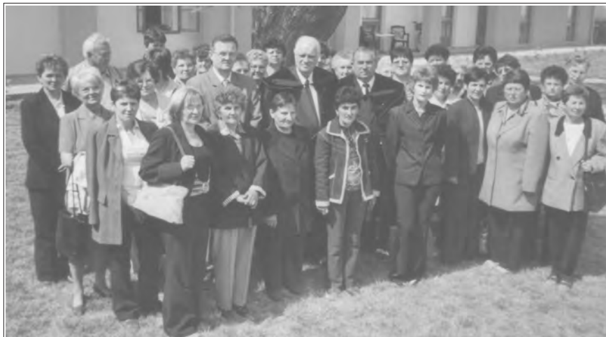
A felvidéki énekkarok tagjai

ezek a Kárpát-medencében élő gyülekezeteket összehozó találko-