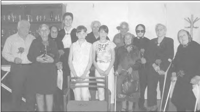
A gyermekek a Diakóniai Központban

Anyák napi istentiszteleteink sorát Runyában kezdtük meg, ahol gyerme-