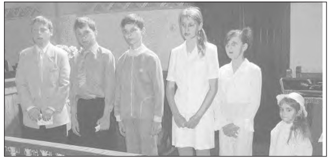
A lénártfalvai gyermekek

helybeli gyermekek szolgáltak versekkel és énekekkel.