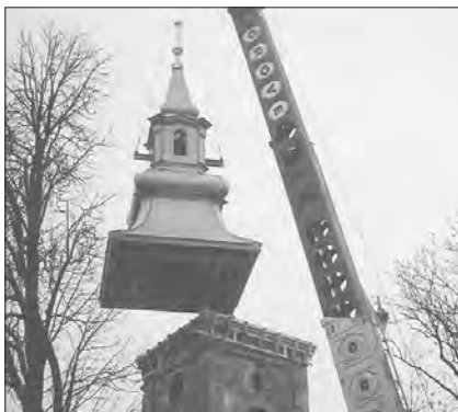
Helyére kerül a nagykáljai toronysisak

A nagykáljai református templomot 1944. december 24-én orosz gránátámadás érte, aminek következtében a templomot évtizedekig nem használták.