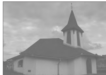
A füleki templom