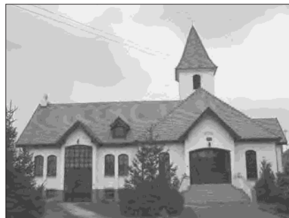
A bögellői templom