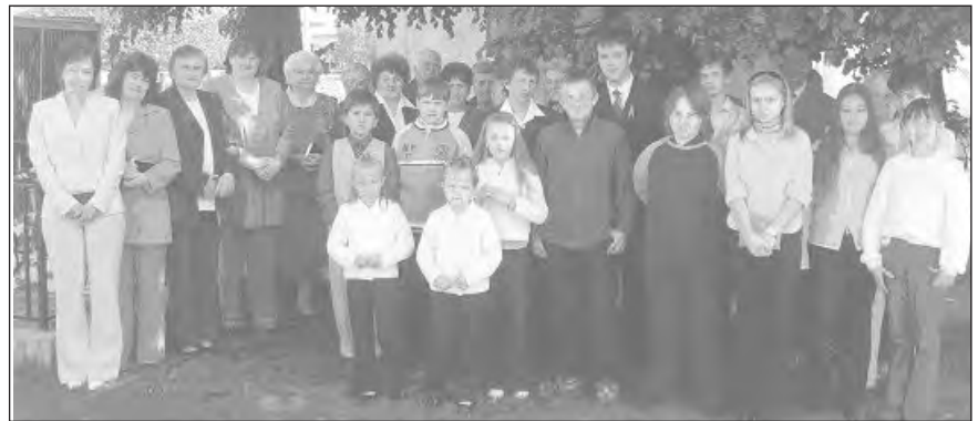
A runyai ünneplő közösség