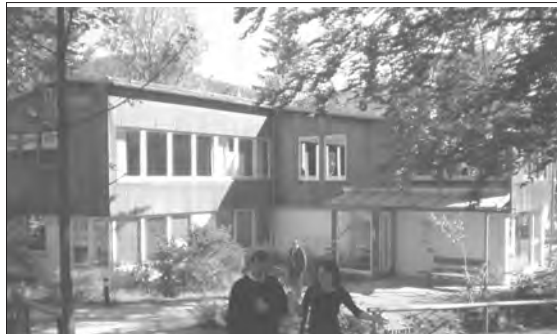
A tanácskozásnak helyet adó központi épület

A felvezető előadásokat rendszerint csoportos beszélgetések követték, ahol a