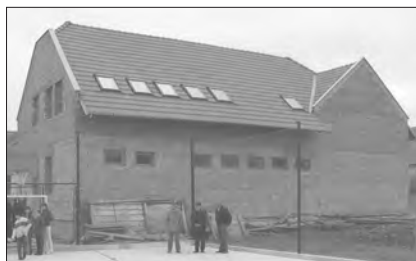
Az alistáli iskola új épülete

2007-ben az alistáli református alapiskola új iskolaépületére 4000 eurót, a