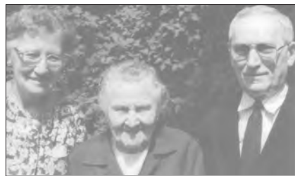
Feleségével és anyósával