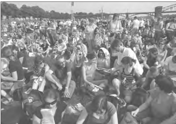
Csapatunk egy része a nyitó istentiszteleten