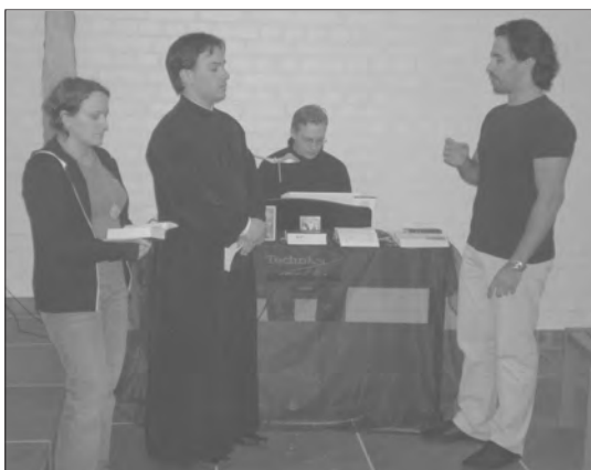
Egy lengyel, román, orosz és szerb ortodox résztvevő által megtartott ortodox áhítat

A reggeli és az esti áhítatok sokszínűsége, a záró úrvacsorás istentisztelet anglikán szertartás szerinti megélése a kis kápolnában nagyszerű élményt jelentett. A vaskos ökumenikus énekeskönyvből jó volt felfedezni azokat a német szerzeményű énekeket, amelyek magyar szöveggel református gyülekezeteinkben is használatosak, akárcsak a magyar nyelvű énekeket. A búcsústen az evangélikus, római katolikus, ortodox, valdens, csehtestvér, református és huszita egyházból érkezett lelkészek és egyházi munkások