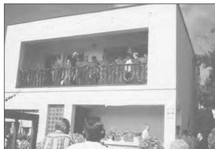
A párkányi gyülekezeti ház

1993-ban és 1994-ben két kisebb projekt is megjelenik a katalógusban. A párkányi gyülekezet szörványból gyorsan leányegyházközséggé fejlődött, és elindult az önállóodás útján. A gyülekezet aktív tagjai nagy hittel és sok reménységgel mindent megtettek azért, hogy anyaegyházközséggé váljanak. A város központjában házat vettek, ami-