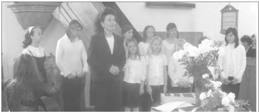
A zsigárdi gyermekkórus

Ímelyen elsősorban a már évek óta visszatérő zsigárdi és hetényi gyermekcsoportnak örülhettünk. Először volt közöttünk a csúzi ökumenikus kórus. A Hetényről, Marcellházáról és Bátorkesziről érkező gyülekezeti kórusok már szintén visszatérő vendégei a találkozóknak. Idén a szomszédos Tatai Református Egyházmegye is – továbbá ápolva az egyházmegyei testvér-