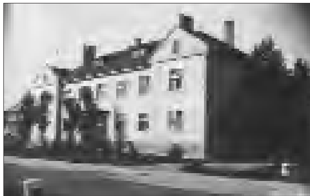
Az árvaház egy 1946-ban készült felvételen