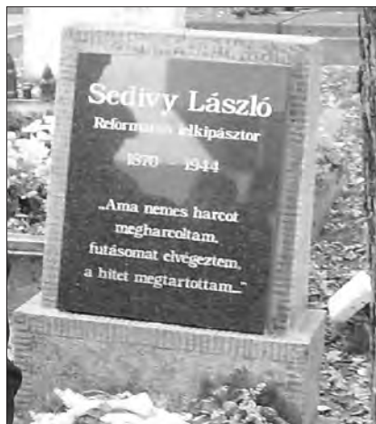
Sírköve a nyitrai temetőben