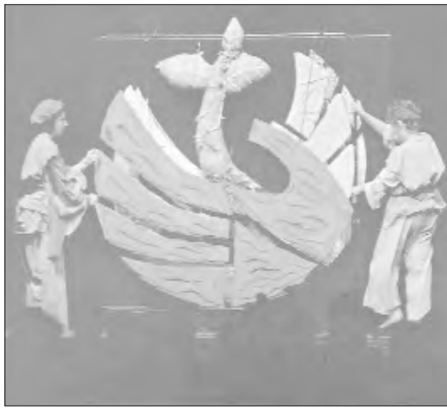
A latin-amerikai esten kiabrázolt logó a teremtést, a békét és Istennek az emberrel kötött szövetségét szimbolizálja.

A Kárpát-medencei egyházi és nemzeti kisebbségekhez tartozók számára egyik legfontosabb kérdés az volt, hogy az RVSZ accrai nagygyűléséhez hason-