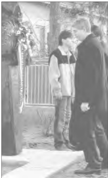
Bugár Béla, a parlament elnöke koszorúz

Szokásunkhoz híven az idén is megemlékeztünk templomunkban a dicső 1848–49-es forradalomról és szabadságharcról, amit nem csak a kokárda s a (templomunkban állandó jelleggel kifüggesztett) címeres zászló szimbolizál. Templomunk teret adott az imának, a csendnek, a meghitt ökumenikus közösségnek, ahol szeretettel vendégül láttuk a helyi baptista és római katolikus testvéreinket is.