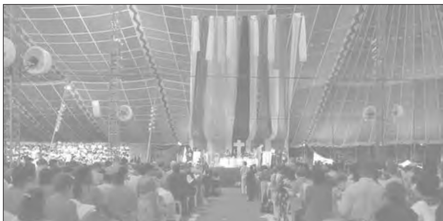
Az áhítatok és az istentiszteletek a nagy befogadóképességű sátorban voltak

tak reggeli és esti áhítatok, bibliatanulmányok, amelyek spanyol, portugál, angol és német nyelven folytak, de a plenáris ülésekre még francia szinkrontolmácsolást is biztosítottak.