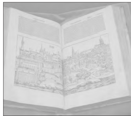
Az egyik könyvritkaság

vet, melyek közt rendkívül értékes könyvritkaságok vannak: huszonkét ösnyomtatvány (vagyis 1500 előtt kiadott mű), egy kódex, több Biblia stb. Így a kiállított könyvek közt láthatunk egy eredeti (tehát 1590-ben kiadott) Vizsolyi Bibliát, Lorántffy Zsuzsanna 1608-as Hanau Bibliájában pedig olvashatjuk saját bejegyzését. Augustinustól a De civitate Dei (Basel, 1490), Bél Mátyástól egy 1707-ben Hálában nyomtatott munka, Dávid király zsolttárainak Szenczi Molnár Albert által fordított és Lőcsén 1652-ben kiadott példánya és Balassi Bálint németből fordított munkája, a Beteg lelkeknek való