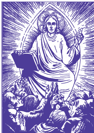
Rudolf Nehmer fametszete

Krisztus-hitből; tehát a hitre alapozott, Istentől való igazsága van (Fil 3,8–9). Ezért az apostol a zsidókról, akik az igazság megszerzésének régi útján maradtak, ezt írja: „...tanúskodom mellettük, hogy Isten iránti buzgóság van bennük, de nem a helyes ismeret szerint. Az Isten igazságát ugyanis nem ismerték el, hanem a magukét igyekeztek érvényesíteni, és nem vetették alá magukat az Isten igazságának” (Róma 10,2–3).