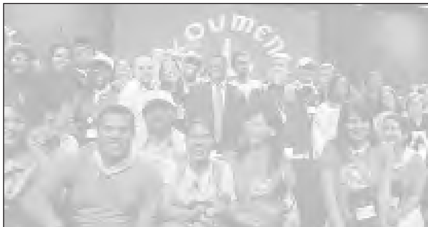
Samuel Kobia, az EVT főtitkára a fiatal keresztyének körében

Az EVT-nek az elkövetkező években egyre inkább szüksége lesz arra, hogy a fiatalok aktív részvételét a középpontba helyezze, mert ők jelentik az egyház és