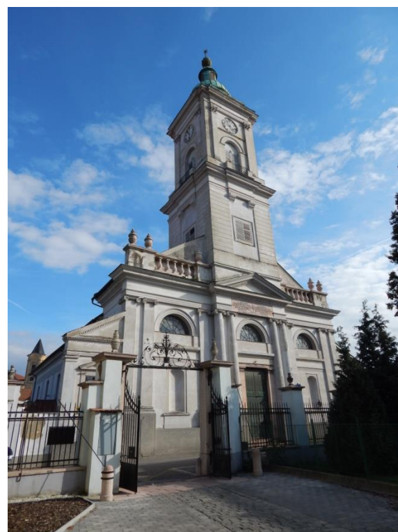
Komárom - 1895