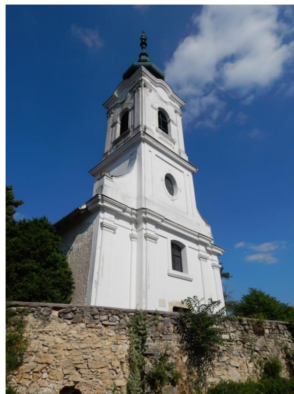
Vilonya - 1827